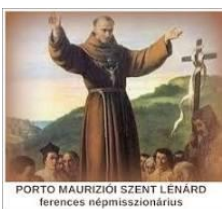
PORTO MAURIZIÓI SZENT LÉNÁRD ferences népmisszionárius