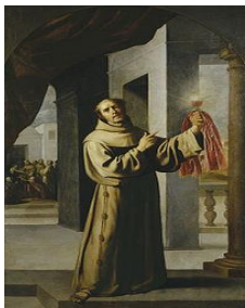
Francisco de Zurbaran Marchiai Szent Jakab

A hagyományban élő adat, hogy 60-ban az achaiiai Petra városában keresztre feszítették. Keresztjének szárait nem derékszögben, hanem átlósan (X alakban) ácsolták, ezért nevezik András-keresztnek ezt a formát.